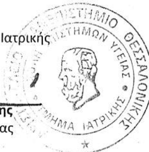
Αστέριος Καραγιάννης Καθηγητής Παθολογίας